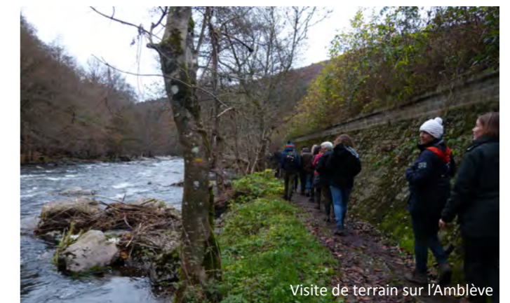
Visite de terrain sur l'Ambève

Vous souhaitez recevoir plus d'informations sur notre projet ?