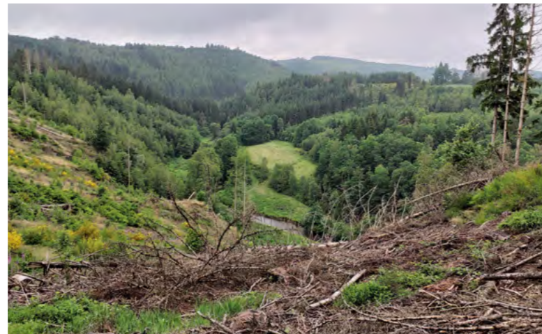
Mise à blanc - Ourthe orientale en amont d'Houfalize

Pour mettre en place ses différentes actions, l'équipe du projet LIFE collaborera tout au long de la durée de celui-ci avec les différents acteurs de terrain, comme les gestionnaires forestiers, les gestionnaires des cours d'eau ou encore les contrats rivières.