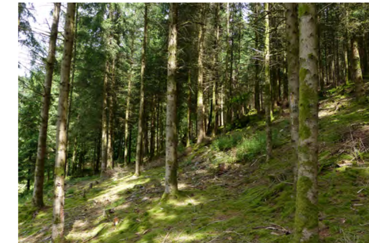
Bassin inférieur de l'Ourthe orientale