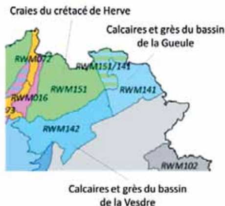
Masses d'eau souterraines du Pays de Herve. Lien vers la carte : http://eau.wallonie.be/IMG/dhimeso.jpg

Les nappes aquifères au sein desquelles se situent ces masses d'eau (aquifères du Crétacé du Pays de Herve et du massif de la Vesdre), fournissent 0,2 et 2,4 millions de m 3 d'eau par an, ce qui représente un peu moins de 1 % des prélèvements annuels dans les nappes d'eau souterraines wallonnes. Au total, 72, 56 et 38 prises d'eau sont recensées dans le crétacé de Herve, le bassin de la Vesdre et le bassin de la Gueule. Mais une partie seulement de ces prises d'eau est destinée à la production d'eau potable et la distribution publique. On en recense 5 dans les craies du Crétacé de Herve, 34 dans le bassin de la Vesdre (réseau de captage de Chaudfontaine) et 6 dans celui de la Gueule. Les autres usages recensés concernent l'activité industrielle, agro-alimentaire et agricole.