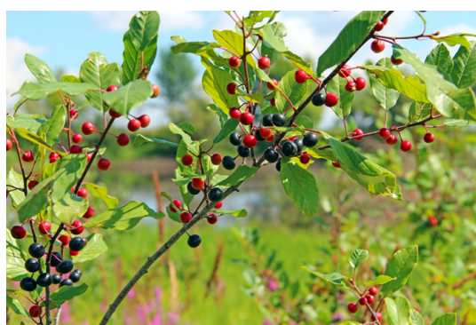
Fruits de bourdaine